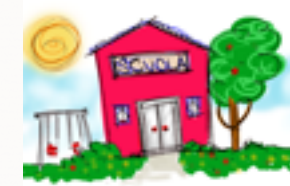
La scuola vista dai bimbi

Dal mese di aprile, la Pro Ticino conta una scuola in più: si tratta della scuola della sezione di Ginevra. Le altre scuole sono attive nelle sezioni di Basilea, Delémont e Zugo. In totale ci sono oltre 40 allievi.